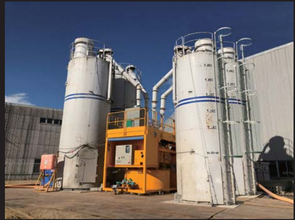
供給能力 120t/H(30T/Hの場合=4本 /40T/Hの場合3本)のセメントサイロを設置して下さい